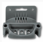
5002 S2 - Matrix - Holder