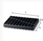
5003/20H - Matrix - Plastic tray