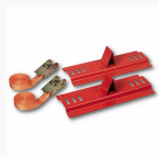
5002 S1 - Matrix - Holder