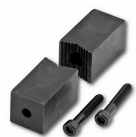
498 GD - Pipe clamp jaws