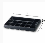
5003/13H - Matrix - Plastic tray