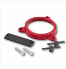
498 GE - Swivelling support