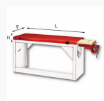
5002 ZM4 - Matrix - Worktop with vice