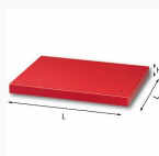
5002 Z1 - Matrix - Spacer